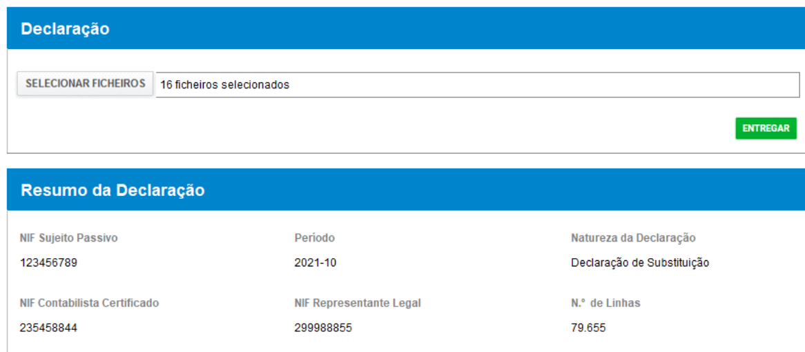
Figura 8 - Entrega de Declaração via Ficheiro