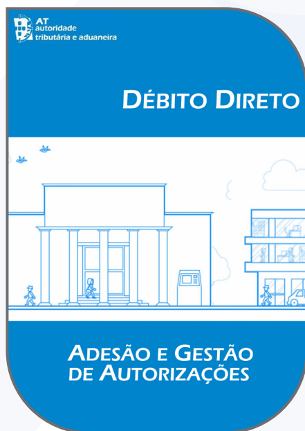
PAGAMENTO DE IMPOSTOS POR DÉBITO DIRETO