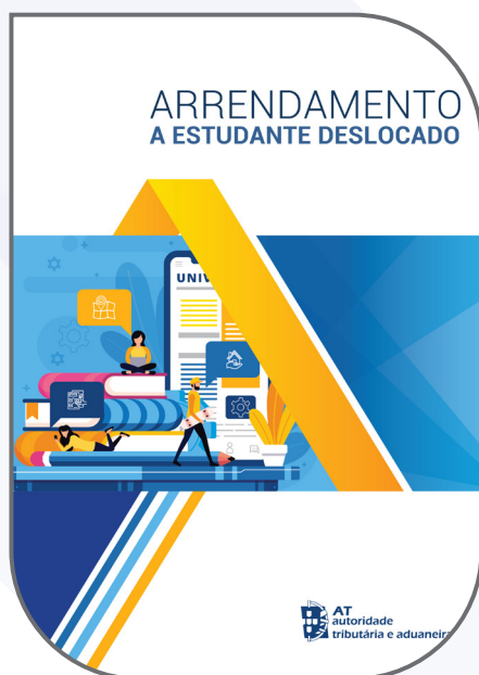
ARRENDAMENTO A ESTUDANTE DESLOCADO